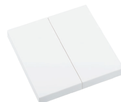
RTS23-ACC-01-xxP2 2x EIN/AUS