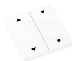
RTS23-ACC-03-xxP2 1x AUF/STOPP/ZU