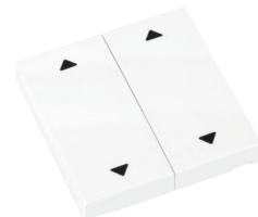
RTS23-ACC-02-xxP2 2x AUF/ZU